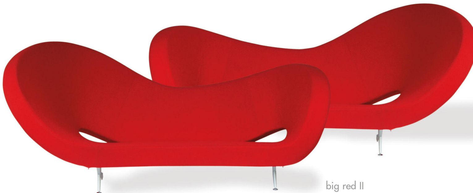
big red II

weitere ausführungen auf anfrage welle rechts welle links