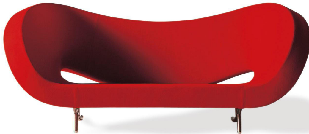
big red I